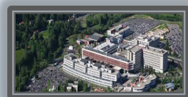
CHU de Saint-Etienne 1800 Lits

L'arrivée d'une crise sanitaire dans un établissement de santé impose une organisation et une gestion du parc d'équipements Biomédicaux très stricte.