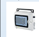
Ventilateurs de transport

Centraliser, commander et réceptionner les DM disponibles