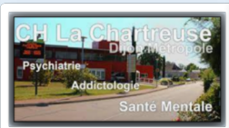
CH Psy Dijon 500 Patients