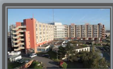
CH Roubaix 1255 Lits