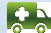
Livraison et mise en service